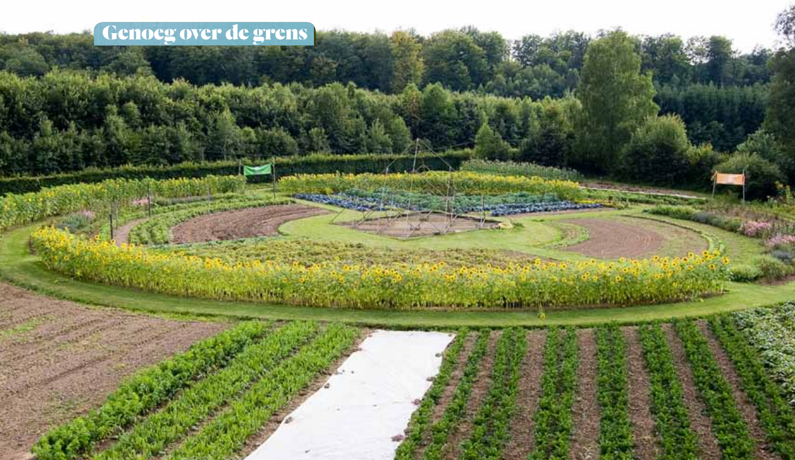
De groenten- en kruidentuinen zorgen voor voldoende opbrengst voor de vaste bewoners en vakantiegasten.