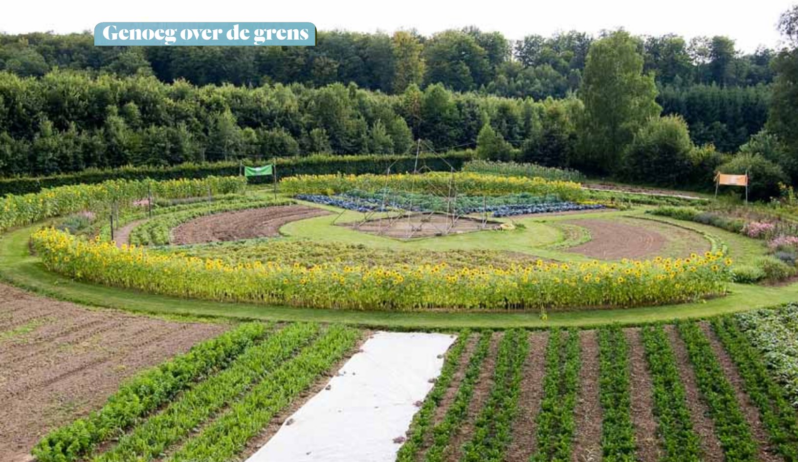
De groenten- en kruidentuinen zorgen voor voldoende opbrengst voor de vaste bewoners en vakantiegasten.

werkgemeenschap heeft bestaansrecht gekregen en is in het stadium van de jongvolwassene gekomen. Dat betekent dat de contouren van onze identiteit steeds duidelijker worden.' Hoe krijgen ze dit allemaal voor elkaar? De Blaauw: 'We zijn een vereniging. De vaste bewoners werken tegen kost