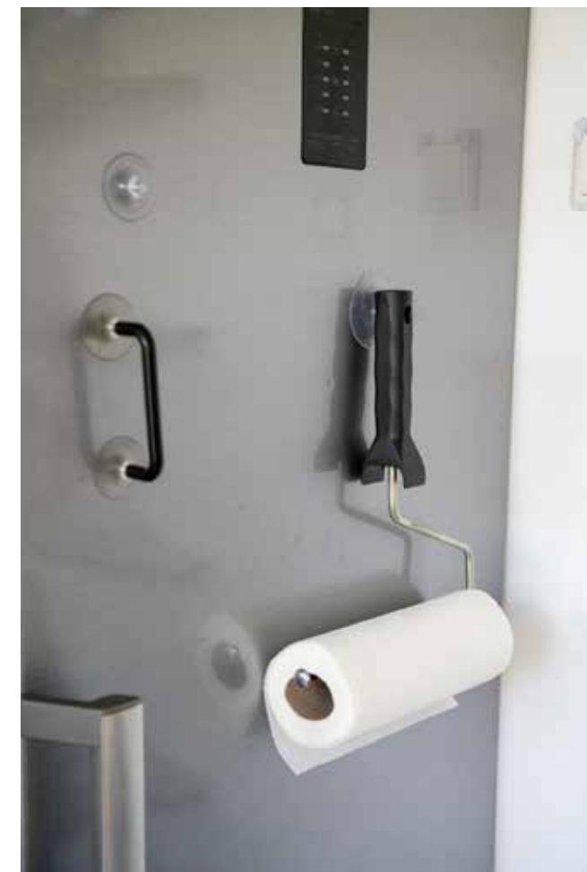
Verfronbeugel + zuignap + verchroomde borgclip = keukenrolhouder