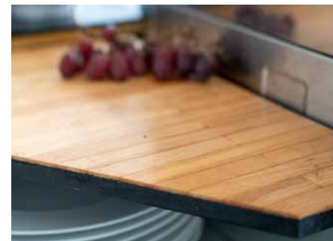
Roerhoutjes van de bouwmarkt + lijm + lak = keukenblad (meer dan 15 jaar oud)