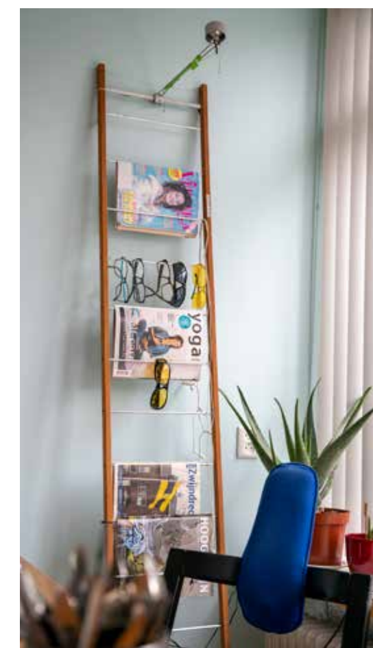
Latjes + buisjes + schroeven = leduurladder

Na zijn studie werkte Kerkhoven een paar jaar als industrieel ontwerper, maar hij nam ontslag ‘toen dat bureau zo groot werd dat er sessies kwamen om je onvrede te uiten’. Liever trok hij met vriendin en eerste zoon (later kreeg hij er nog een) vier maanden door Canada. Daarna kapte hij een sollicitatie voor een baan bij TNO af. ‘Alleen van die procedure werd ik al ziek: iedereen die zich ermee bemoeide, al dat gedoe, al dat gepietlut.’