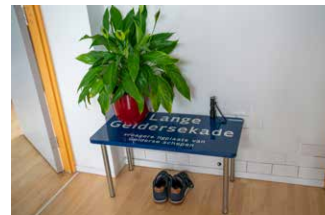
Straatnaambord + poten = tafeltje