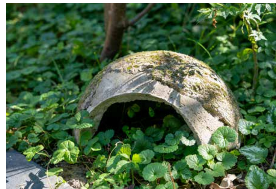
4m³ tegels + specie + zelfgegoten betonnen bollen = 1 Gecko