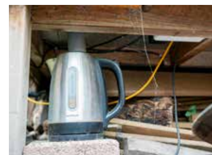
De minisauna werkt op een waterkoker. Een beschrijving van de minisauna staat online op Tinyurl.com/kleinesauna