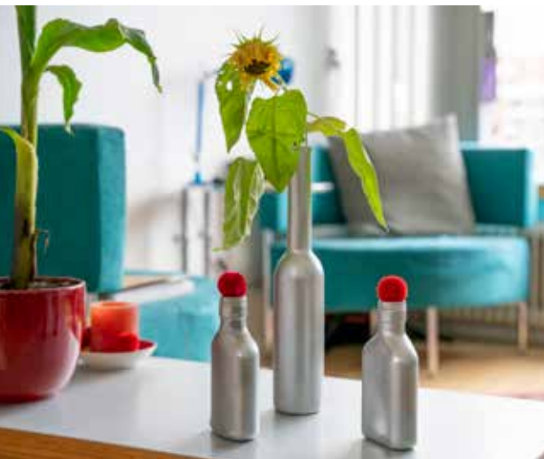
Lege drankflesjes + velgenlak = vaasjes

Voor vrienden zonder houten kozijn bedacht hij een versie met zuignappen. Toen meer mensen er enthousiast over waren, zocht hij een producent. Nu, ruim tien jaar nadat de Bird-Swing op de markt kwam, zijn er 230.000 van verkocht. Nog steeds kan hij een maand per jaar leven van de royalty's.